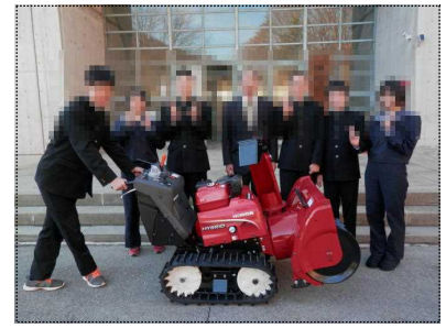
校長先生、生徒会新旧三役で記念撮影

広瀬出身の〇〇〇〇様より、村内小中学校へ寄付金をいただきました。中学校では検討した結果、除雪機1台を購入させていただきました。冬期間、校地内の雪かきは、登校した生徒と先生方で行っています。除雪機のおかげで作業もかなり楽になります。大切に使用させていただきます。ありがとうございました。