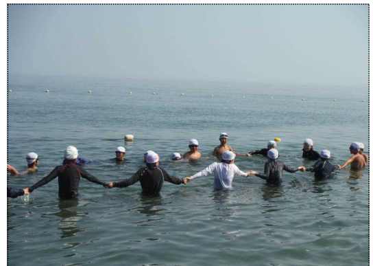
みんなで海の深さを確認し、いざ海水浴！