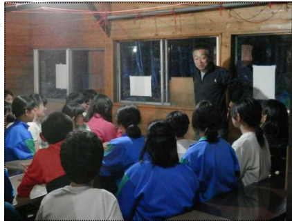
Sさんによる星のお話