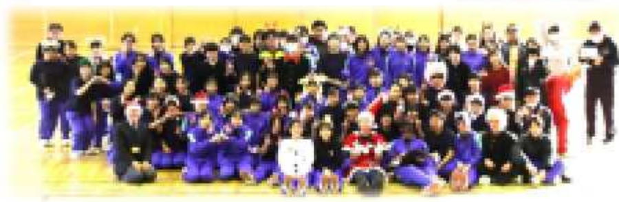
生徒会特別企画 クリスマス会での記念撮影！