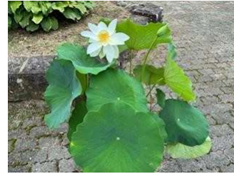
南中“はず”開花。多くの生徒が温かい言葉をかけてくれました。