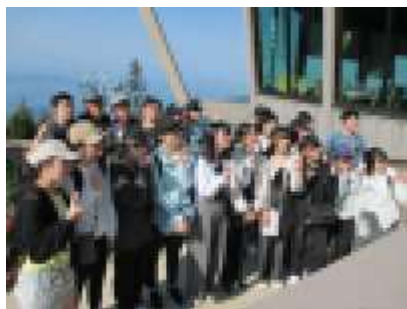
カナダ語学研修旅行では、これまでの学習の成果を発揮しました。みんな元気に無事帰国!