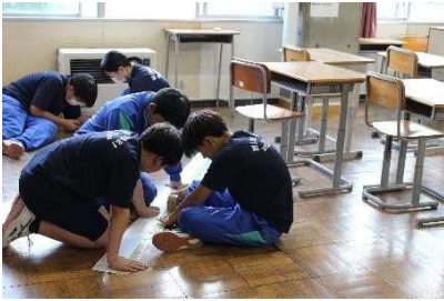
2学期が始まり、南牧祭準備も着々と進んでいます。花壇の草取りも頑張っています。