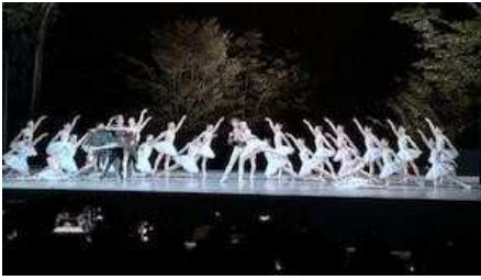
清里フィールドパレに1・2年生の希望者が参加しました。圧巻のステージでした！