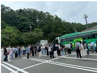
8/6～15まで、3年生がカナダ語学研修旅行に行ってきました!