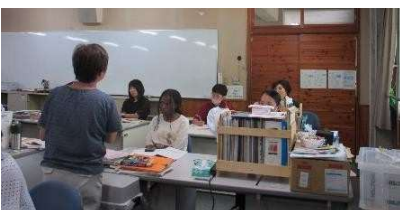
夏休み中に、職員研修として、CAP教職員ワークショップを行いました。11月は保護者対象、12月は生徒対象のワークショップも予定しています。

2学期始業式では、小池校長先生より、パリオリンピックや3年生のカナダ語学研修を振り返りながら、お話しをしていただきました。 「5年ぶりのカナダ語学研修では、3年生の行動力や適応力に感動しました。異国において約束を守る、持ち物や体調や食事の管理がしっかりできていました。」 「カナダの方は、胸を張って、腰骨が伸びている人が多かったです。我々はどうでしょうか。腰骨が伸びると呼吸も整い、内臓の働きもよくなります。自己肯定感が高まると、堂々と胸を張り姿勢もよくなると思います。」とお話しされました。 「自己管理の大切さ」、「姿勢を美しく」この2つのキーワードは職員室前に掲げられています。