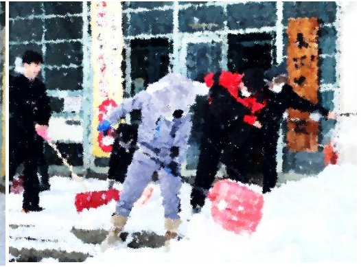
大雪の日の雪かきの様子、全校の力を結集して！