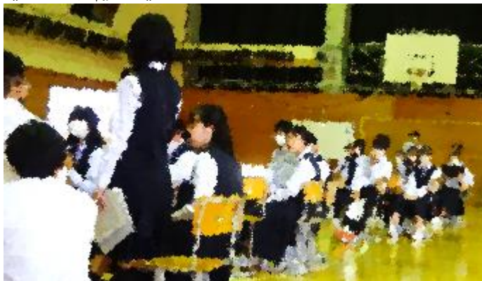
発言者の方に、まっすぐな視線を向けて聞く