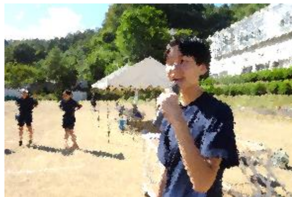
原稿を持たず、伝えたいことを堂々とアナウンス