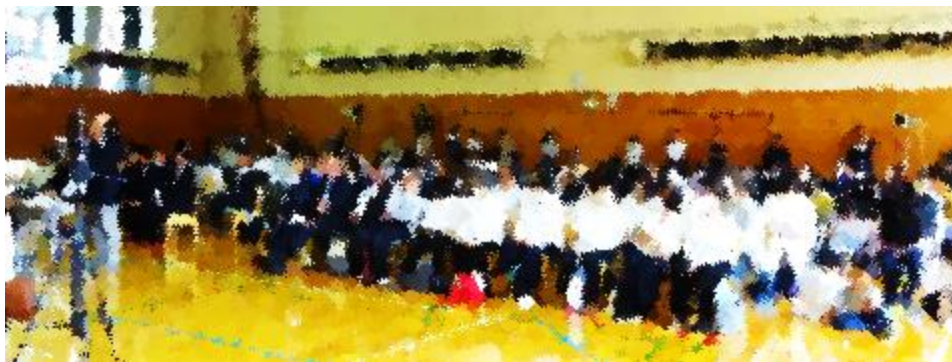
会場いっぱいのご来賓、保護者、地域のみなさん 有難うございました！

お子さん方の体調管理やお弁当の用意等、多くの面で文化祭の活動を支えてくださった保護者の皆様、あたたかく生徒の活動を見守ってくださり、当日も学校においでくださった多くの地域の皆様に感謝を申し上げます。有難うございました。