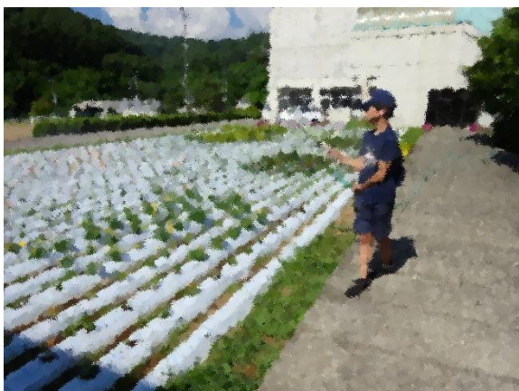
もちろん南牧祭の準備もコツコツと。水やりおつかれさまです