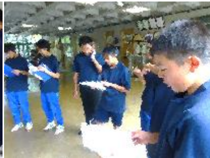
お昼休みのパート練習がはじまりました