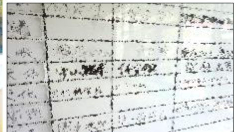
* 生徒会準備、毎日頑張っています！