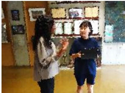
「総合」でインタビュー活動