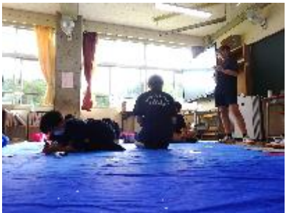
3年生の説明を聞きながら…