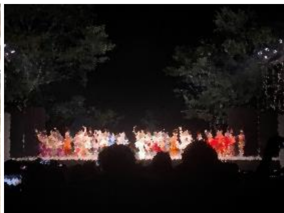
沖縄英語研修旅行では普段の学習の成果を発揮しました。台風の合間に無事帰国！ 清里フィールドパレに2年生が参加 闇夜のステージにうっとり