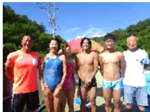
今年もトライアスロンチームが本校プールで世界に向けて練習に励みました