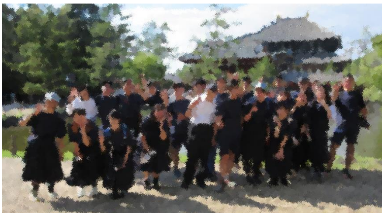
コロナ禍を乗り越えて、3年生の京都・奈良修学旅行大成功！