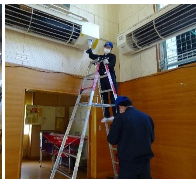
校内のあちこちを、点検・修理していただきました。