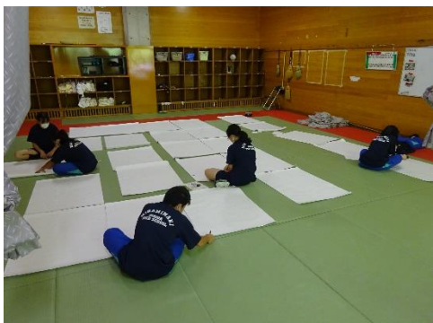
南牧祭に向けて準備を進めています。学年の枠を越えて、1つ1つが手作りです。ステキですね。