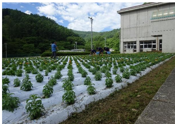
休み中も水やりを欠かさず、花壇の花がスクスク育っています。