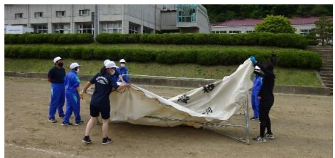
委員の仲間で力を合わせて、テントの設営

延期された6月6日（月）は、朝から強い雨が降り、校庭も大きな水たまりになっていました。「今年の駅伝大会は本当にできるのかな？」そんな不安もよぎりましたが。その翌々日の6月8日、曇り日の中を、ついに駅伝大会を行うことができました。