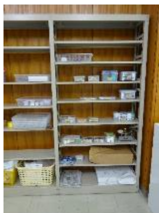
←そんなパズルが棚にはたくさん。いろんな学習道具が増えていきそうです。もちろん WI-FI 完備です。

この日はパズルに挑戦しました、左のビーズのパーツを組み合わせて右のピラミッドを完成させます。これが結構、難しいのです。