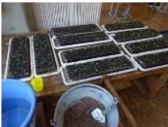
花の苗がすくすく育っています