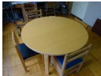
心の相談室に素敵な丸テーブルが入りました