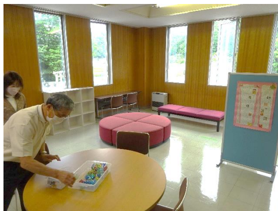
建物の角にある、見晴らしのよい、明るいお部屋です

前号の「すずらん」で紹介した、南牧村の中間教室「ほっとルーム」を見学に行ってきました。中間教室とは、学校とは違った場所で自分なりのやり方、ペースで、時には地域の方のお力を借りながら学習を進める場所です。場所は中央公民館2階にあります。