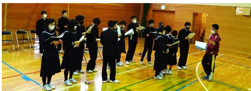
生徒総会のリハーサルに余念のない3年生。今日はその本番の日でした