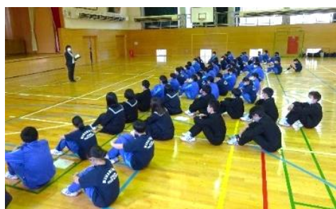
部活動発足会 やりたいことをカいっぱい