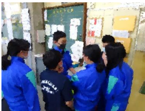
生徒会の仕事の説明をしている3年生