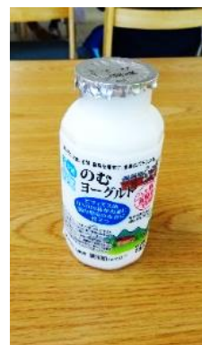
地元の恵みをいただきます