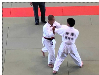
柔道県大会(長野市)

陸上競技、柔道の県大会、吹奏楽のコンクールが行われました。結果は下の通りで、次のステージに進むことはできませんでしたが、それぞれに全力を出して活躍してくれました。ご家族をはじめ、地域の方々にもたくさんの場面でご声援・ご支援をいただきました。改めて感謝申し上げます。吹奏楽部は9月の南牧祭、冬にはスキーやスケートの大会が始まるので、まだ活動を続ける生徒もいますが、3年生の夏の活動はここでひと区切りとなります。3年生が中心となって進めてきたことが、少しずつ1・2年生にバトンタッチされていきます。それぞれに新たな目標や課題に向けてステップアップしてほしいと思います。