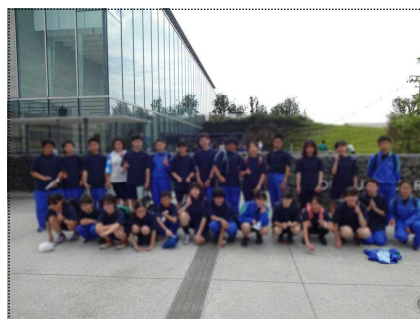
水族館で記念撮影(1年生)