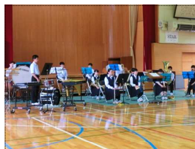
吹奏楽部(壮行会より)