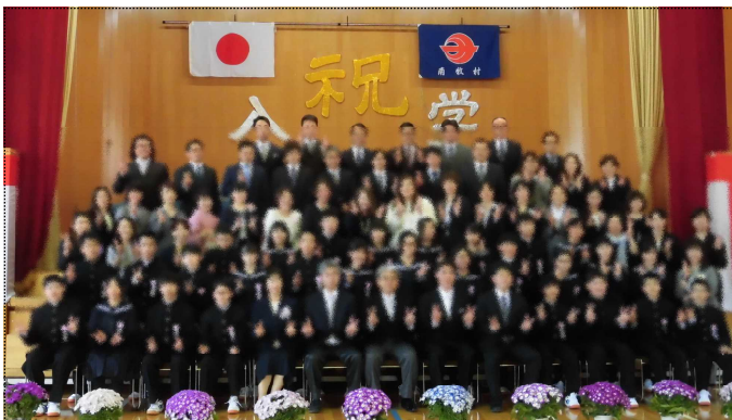
新入生と保護者で記念撮影