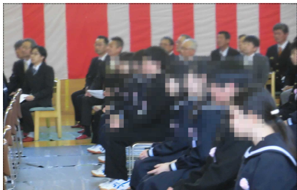
まっすぐ前を見つめる新入生

勉強に運動に、そして仲間づくりに、全校生徒と職員が力を合わせて取り組んでいきます。保護者の皆様、地域の皆様には、多くの面でご協力・ご支援をいただきます。よろしく申し上げます。