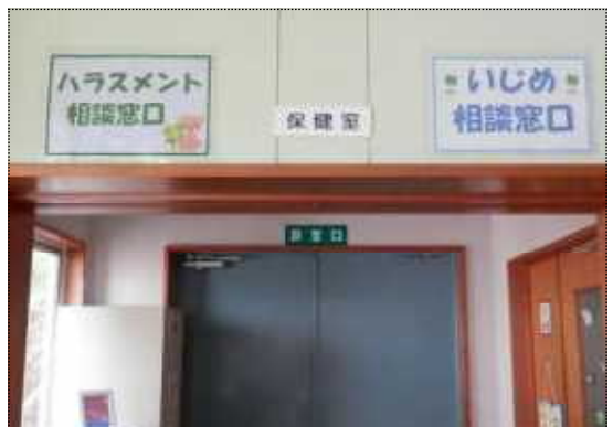
保健室が窓口です

職員の非違行為防止に向けて、月1回のペースで職員研修を行います。今年度も、生徒や保護者・地域の皆様との信頼関係を大切にする学校づくりに努めていきます。