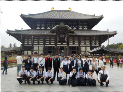
奈良東大寺大仏殿

4月19日～21日まで、3年生が奈良・京都の修学旅行に行ってきました。3日間天候にも恵まれ、昨年から準備してきた係活動や京都市内のタクシー見学などを行いました。当日は観光客も多く、予定した見学地を変更せざるを得なかったグループもあったようですが、しっかりと見聞して、全員元気に帰ってきました。添乗の方からは「挨拶がとても気持ちよい皆さんで、本当にいい旅行のお手伝いをさせてもらいました」とうれしい言葉をいただきました。3日間の旅を無事に終え、たくましさや団結力を身につけた3年生のこれからの活躍に期待したいです。