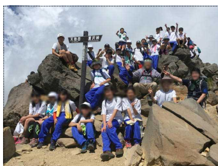
1 A 根石岳にて

1・2年生が7月17日から1泊2日の八ヶ岳登山を行いました。今年は1・2年合同の登山で、係活動や行動訓練を行ってきました。昨年同様「南牧中学校応援団」で信州登山案内人にガイドをお願いし、本沢温泉から夏沢峠をめざして歩きました。天候にも恵まれ、1日目は根石岳、2日目は硫黄岳の登頂に成功。硫黄岳頂上は快晴で、360°のパノラマを満喫しました。全国的に知られる郷土の山「八ヶ岳」です。これを機に、南牧を、登山を好きになり、家族や友人とまた頂上をめざして、南牧の自然の素晴らしさを感じてもらえたらと思います。