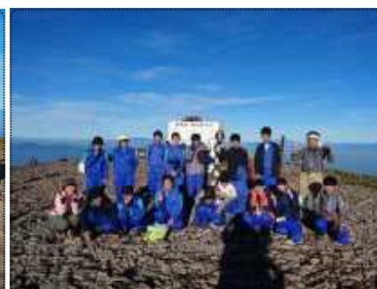
2 B 硫黄岳頂上にて