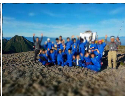
2 A 硫黄岳頂上にて