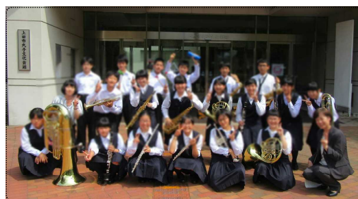
県大会出場を決めた吹奏楽部の皆さん

長野県吹奏楽コンクール東信大会が22日(日)丸子文化会館で行われました。部員19名の南牧中吹奏楽部はB編成の部に出場しました。演奏曲は喜歌劇「サーカスの女王」。息の合った演奏を披露しました。結果は銀賞でしたが、上位4校に与えられる県大会への出場権を獲得しました。県大会は8月4日(土)に松本市で行われます。あと2週間、さらに練習を重ねて最高の演奏をめざします。